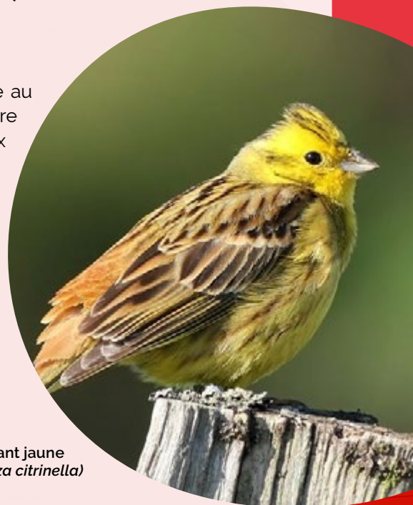
Le Bruant jaune ( Emberiza citrinella )

Profondément ancré au cœur des territoires aux niveaux local et régional, le réseau des CPIE est aussi rassemblé en Union nationale. Cette structuration et cette dynamique à tous les échelons du territoire en fait un réseau accessible, mobilisable et mobilisateur partout en France.