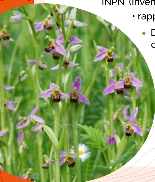
L'Ophrys abeille ( Ophrys apifera )