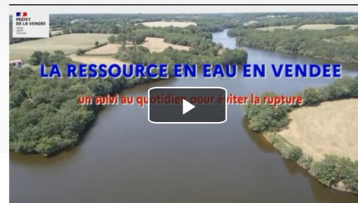
La ressource en eau en Vendée

Ces arrêtés ont pour objet de faire face aux conséquences de la sécheresse et aux risques de pénurie d'eau dans le département de Vendée